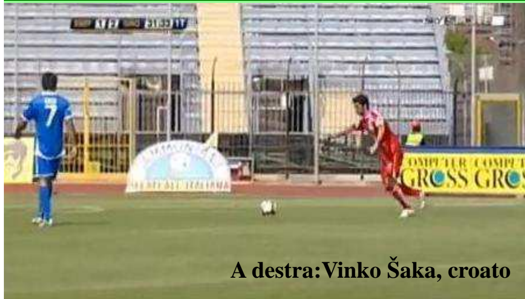
A destra: Vinko Šaka, croato