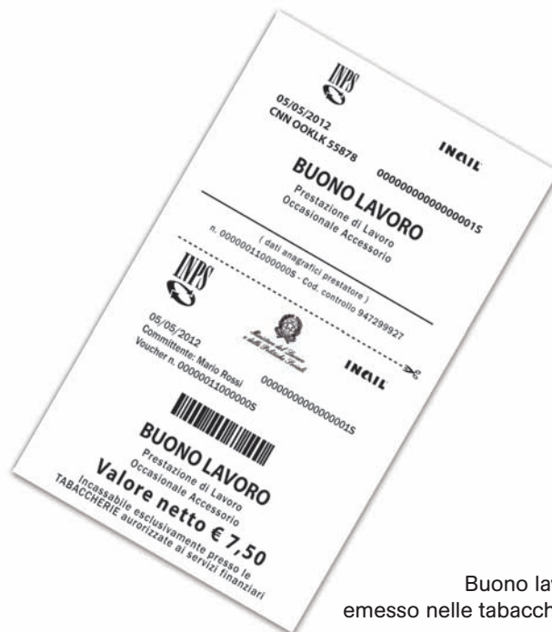
Buono lavoro emesso nelle tabaccherie