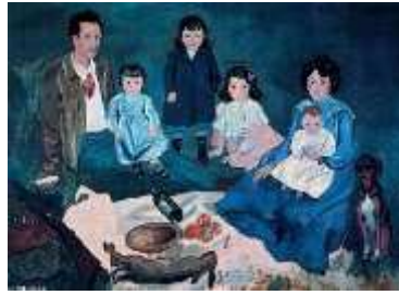
La famiglia Soler